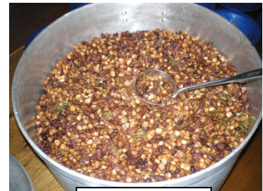
Elke dag krijgen de kinderen een voedzame maaltijd

Wij hopen dat u deze nieuwsbrief weer met veel plezier heeft gelezen.