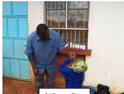
Indien nodig krijgen de kinderen medicatie